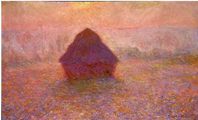
Sollys i tåge